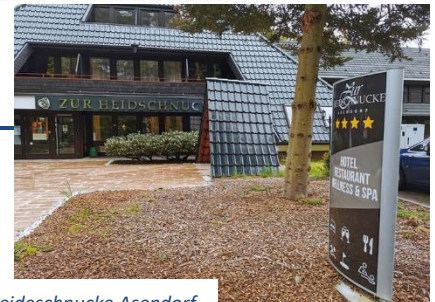
Hotel Heideschnucke Asendorf